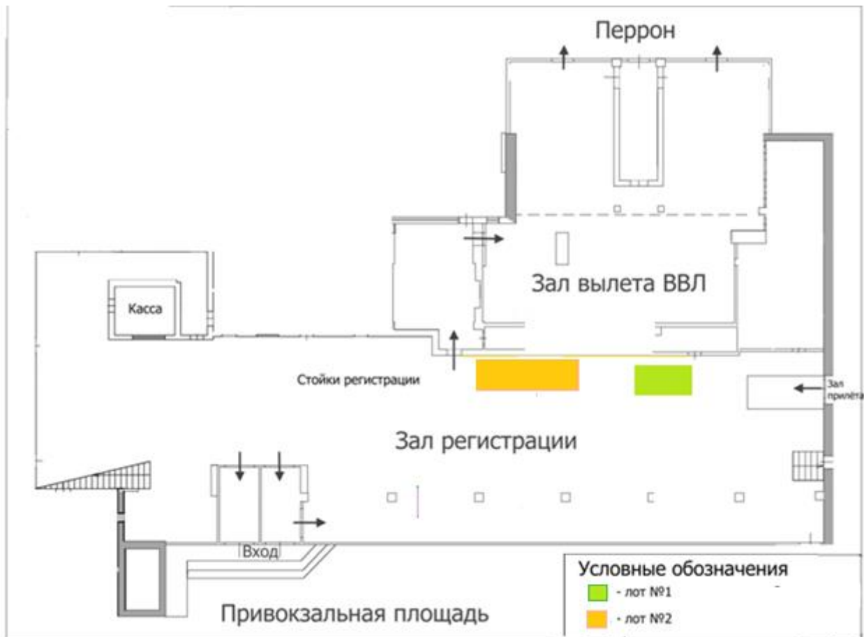
Схема расположения Помещения

ПРИЛОЖЕНИЕ № 1 к договору аренды № _____ от « ____ » _____ 2021г.