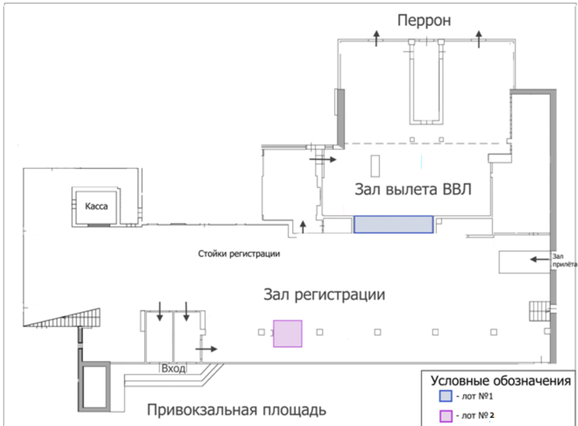
Схема расположения Помещения

ПРИЛОЖЕНИЕ № 1 к договору аренды № _____ от « ____ » _____ 2020г.